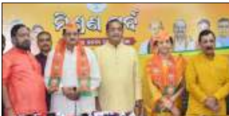
ପୁଲିସ୍ ଡିଭିଜନର ଅଧ୍ୟକ୍ଷଙ୍କୁ ମାଳକାନଗିରିର ସମୀକ୍ଷା ପ୍ରଦାନ କରିବା ପାଇଁ ଉପସ୍ଥାପନ କରାଯାଇଛି ।