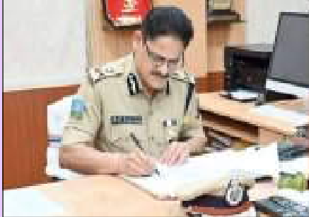
ମାଳକାନଗିରି, ୧୫/୪ (ବି/ପ୍ର) : ପୁଲିସ୍ ଡିଭିଜନର ଅଧ୍ୟକ୍ଷଙ୍କୁ ମାଳକାନଗିରିର ସମୀକ୍ଷା ପ୍ରଦାନ କରିବା ପାଇଁ ଉପସ୍ଥାପନ କରାଯାଇଛି ।