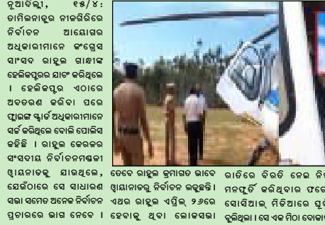
ତାମିଲନାଡୁରେ ରାହୁଲଙ୍କ ହେଲିକପ୍ଟର ଯାତ୍ରା ଆରମ୍ଭ ହେବ ।

ନିର୍ବାଚନ ପାଇଁ ଖୁସୀନାଚାଲୁ ପ୍ରତିଦ୍ୱନ୍ଦ୍ୱୀତା କରୁଛନ୍ତି । ଆସନ୍ତା ଲୋକସଭା ନିର୍ବାଚନ ପାଇଁ ତାମିଲନାଡୁରେ ରାହୁଲଙ୍କ ଯାତ୍ରା ଆରମ୍ଭ ହେବ ।