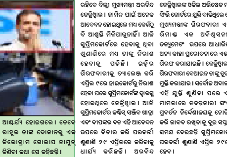
ନିର୍ବାଚନ ପାଇଁ ଖୁସୀନାଚାଲୁ ପ୍ରତିଦ୍ୱନ୍ଦ୍ୱୀତା କରୁଛନ୍ତି ।