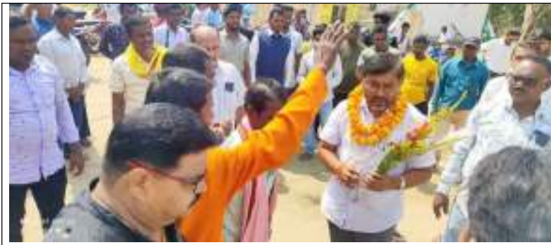
ଆଜି ସୁନ୍ଦରୀରେ ସର୍ବ ନିର୍ବାଚନ ମଙ୍ଗଳା ପାଇଁ ଉତ୍ତମ ମାଧ୍ୟମିକ ପୁରସ୍କାର ପ୍ରଦାନ କରାଯାଇଛି ।

ଭାରତକେଲା, ୮/୪ (ନି/ପ୍ର): ଡିଆଇସି କୁଇଜ୍-ସମ୍ରାଟ ଓ ଉତ୍ତମ ମାଧ୍ୟମିକ ପୁରସ୍କାର ପ୍ରଦାନ ହେଉଛି ।